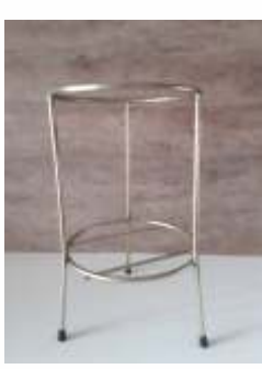
Suporte de Solo Bicromatizado