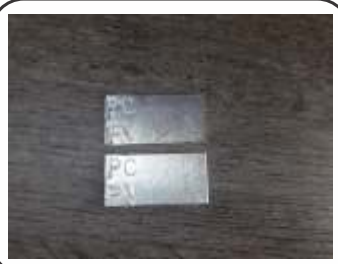
Etiqueta Alumínio p/ Válvula Co2 PC / PV