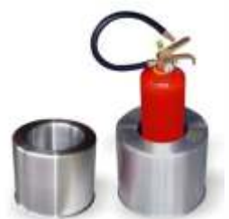
Suporte Solo Alumínio Escovado