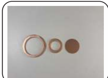
Arruela Cobre Maior e Menor / Disco de Segurança Válvula CO2