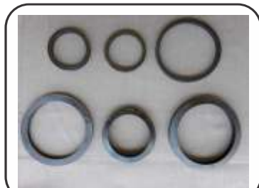
Anel Borracha Guarnição Empatação / Encosto