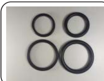
Anel Oring para M30 / M22 Grosso e Fino