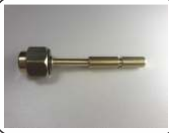
Pino para Válvula Co2 Yane