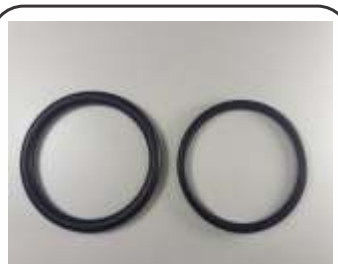
Anel Oring para Válvula P20 Grosso e Fino