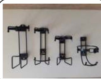
Suporte Veicular P1 e 2 Kg / Universal Fiat / Monza