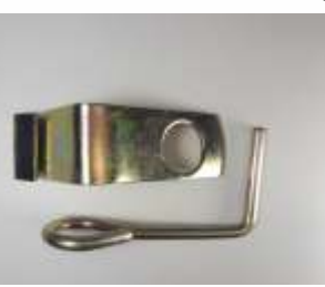
Conjunto Apague Metal