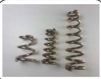
Molas p/ Válvulas Co2 M30 Curta Média e Loga