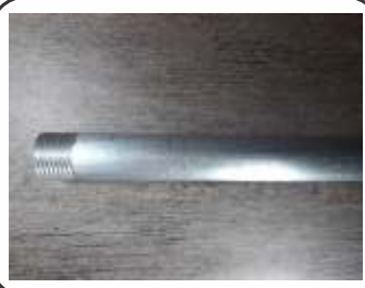
Sifão Alumínio 480mm / 540mm 90mm