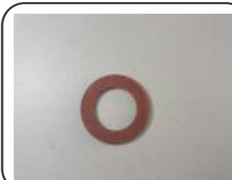
Arruela Fibra Vermelha 12,0 x 19,0 x 1,5 mm