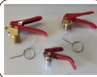
Válvulas Modelos: M30 / AP / Pó / CO2 M22