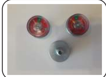
Manômetro Aspiral 1.0