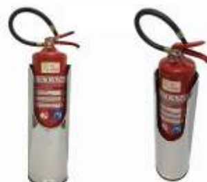
Suporte Solo em Inox Modelo Baton