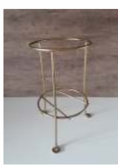
Suporte de Solo Bicromatizado com Arruela de Fixação