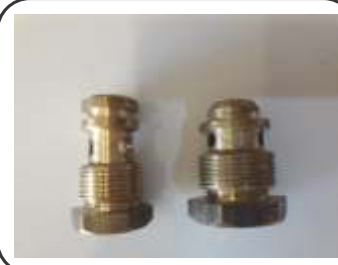
Miolo p/ Válvula Co2 Ita / Yanes / Mangflex Protega