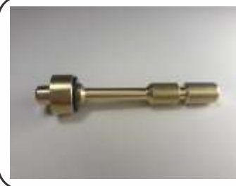
Pino para Válvula Co2 Protege