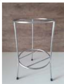
Suporte de Solo Cromado