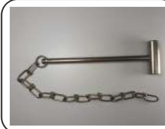
Martelinho com Corrente