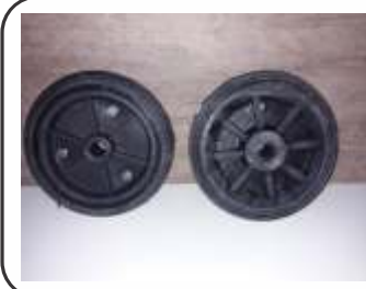
Rodas de Borracha maciça p/ extintor P20 kg