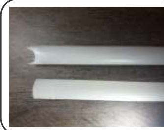
Sifão PVC 600