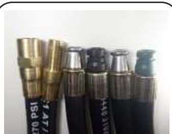
Manguerias PVC p/ Extintores Co2 6 kg Água 10L / P4 6-8-12 Kg