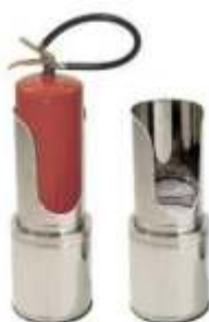
Suporte Solo em Inox Modelo Baton Torre