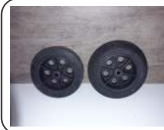
Rodas de Borracha maciça p/ extintor P20 kg