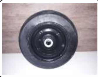
Rodas de Borracha maciça p/ extintor 50 Kg