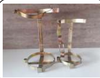
Suporte Veicular Reforçado p/ Extintor P4,6,8 e 12 Kg