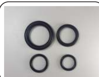
Anel Oring para Miolo Co2 p/ Yanes Ita / Portega / Mangflex