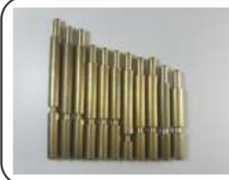
Pinos para Válvulas M30 Diversos Tamanhos