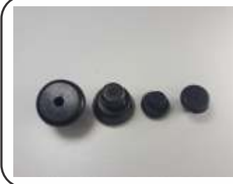
Pera para Válvulas M30 / M22