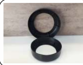
Saia Plástica Modelo Yanes AP / PÓ