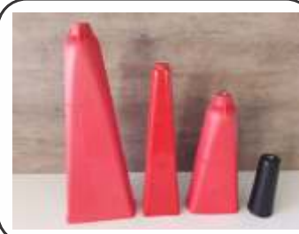
Difusores Modelos Regular / MK Grande e Médio / CO2 2 Kg