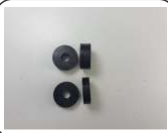
Vedação para Pino Co2 Alta / Baixa