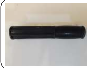
Punho Plástico Perto