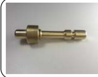
Pino para Válvula Co2 Mangflex