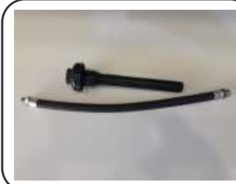
Mangueira PVC Espuma Mecânica 9-10 L