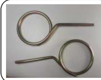
Trava Comum M30 / CO2