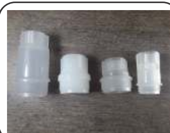
Bucha Plástica M30 Curta e Longa